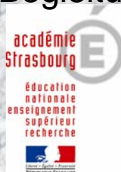
Grundtvig 2- Lernpartnerschaft Partnerbesuch in Strassburg, Mai 22 / 23